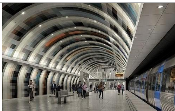
Bilderna visar utformningsförslag som kan komma att justeras.