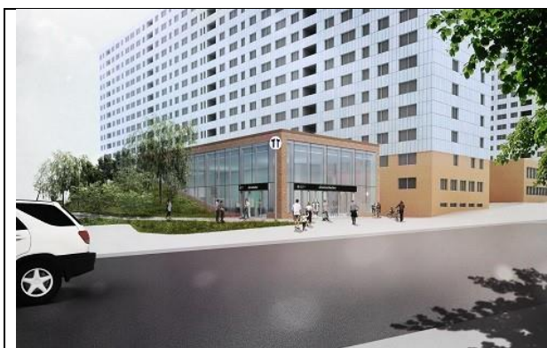
Gula tunnelbanan Arenastaden uppgång Hagalundsgatan 1

Under perioden 2021 – 2026 kommer den nya tunnelbanans "Gulalinje" att färdigställas.